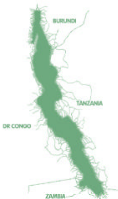
Littoral du Lac Tanganyika

La structure opérationnelle du projet est esquissée dans l'illustration 1. En haut de la pyramide, on trouve le Comité de Direction du Projet (CD) composé d'un petit groupe de hauts fonctionnaires recrutés parmi les agences dirigeantes du projet dans chacun des pays (se reporter à l'encadré). Le Comité de Direction est chargé de diriger la globalité du projet et d'orienter les politiques, il est secondé par le Comité Consultatif de Conseil Technique Régional. Le récent examen de projet a recommandé de constituer des Comités de Direction Nationaux dans le but de réunir dans chaque pays des responsables ministériels des autres